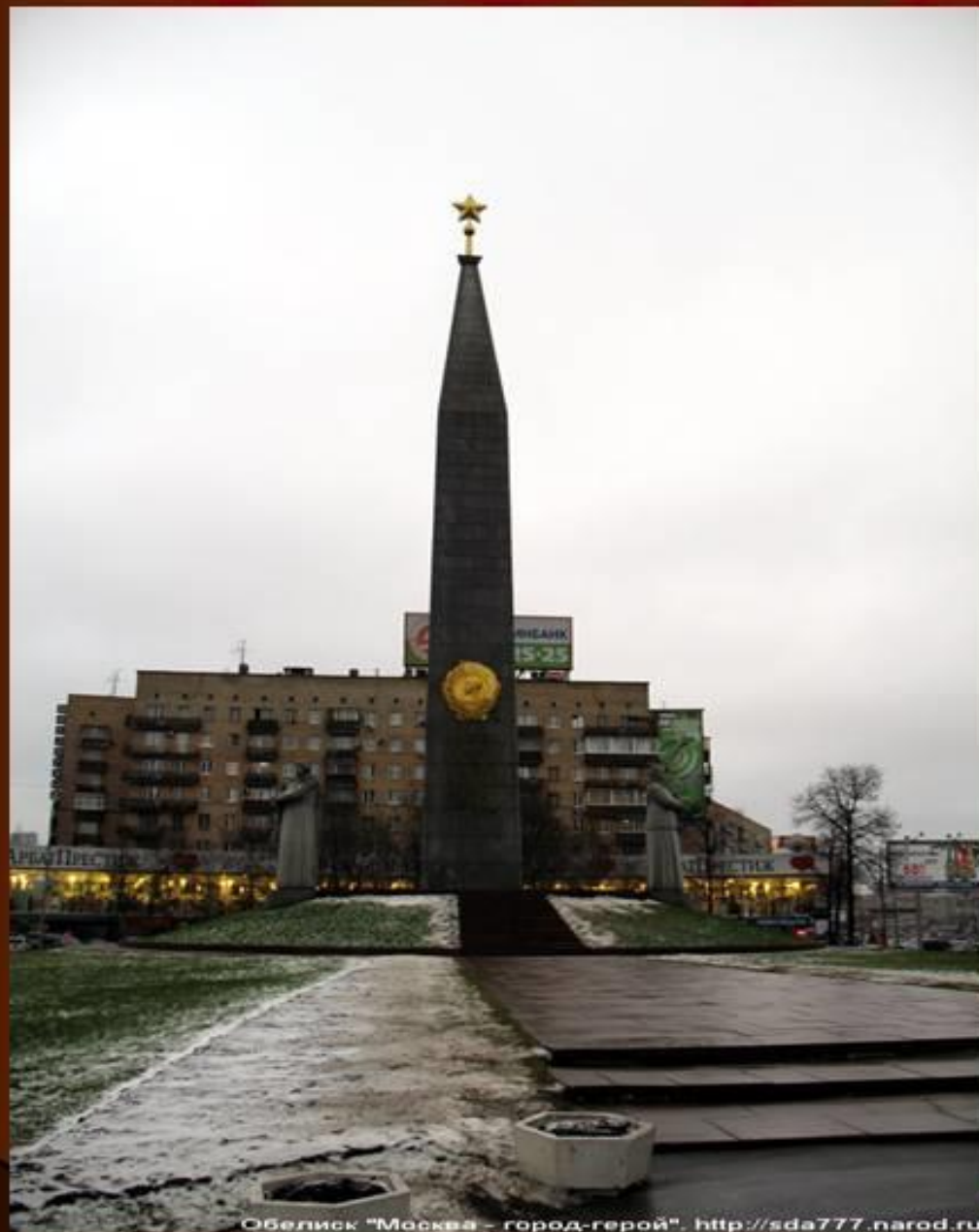
Обелиск "Москва - город-герой". http://sda777.narod.ru

В битве под Москвой развеялся миф о непобедимости немецкой армии